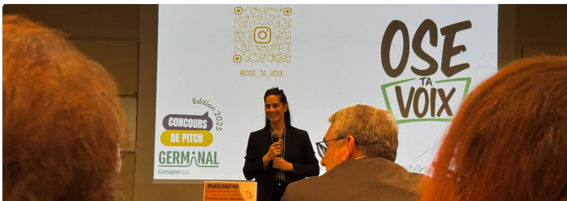
Ose ta voix - Lauréate édition 2025

Ils fabriquent, coiffent, réparent, cuisinent, vendent, développent des services... Partout dans l'Essonne, des entrepreneurs construisent leur activité avec détermination.